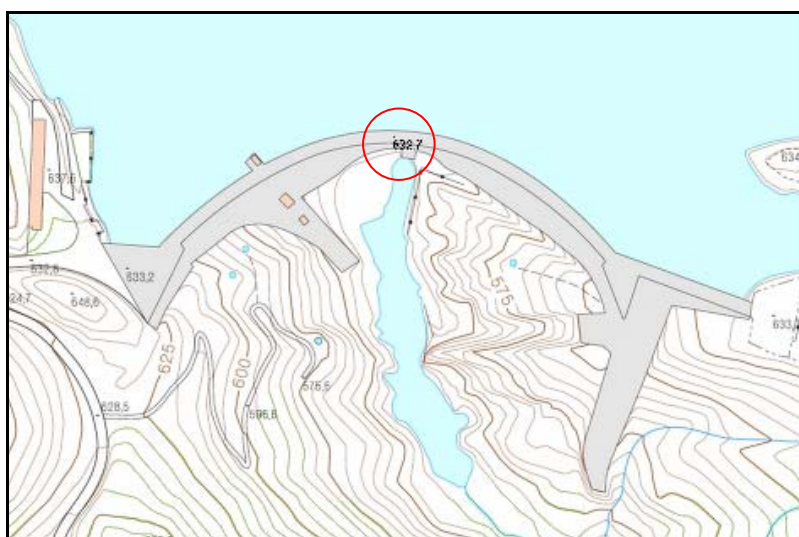
Punto de Cota en Construcción elevada