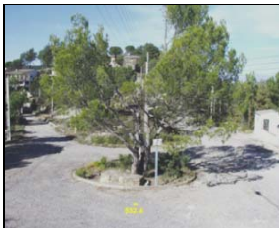
Punto de Cota en Terreno